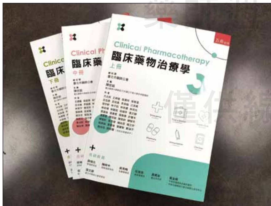
↑臺灣本土第一本「臨床藥物治療學」上中下三冊。