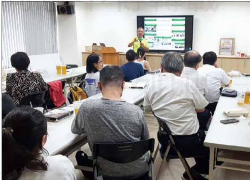
↑台南市藥師公會於8月1日舉辦「南市藥師記者培訓營」。