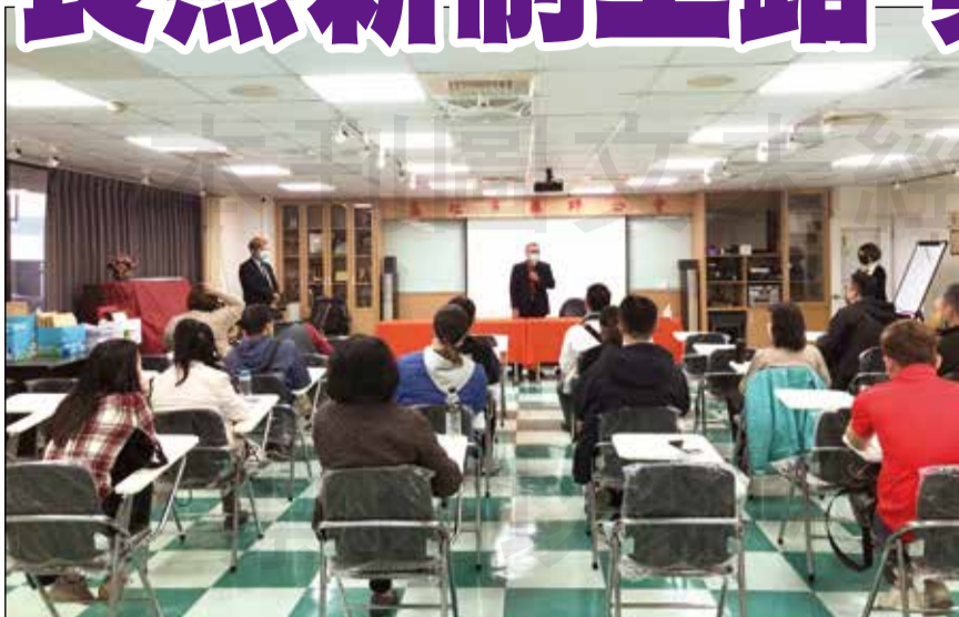
↑高雄藥師公會舉辦2023「長照專業服務最新發展趨勢暨到宅藥事照護」座談會。