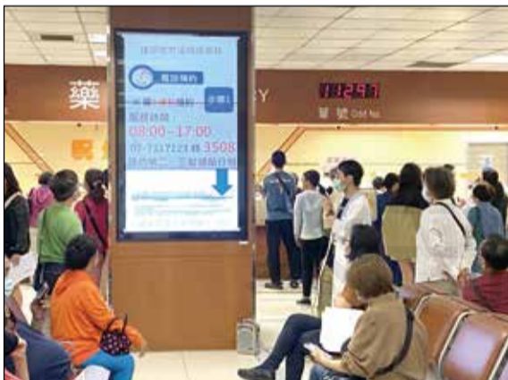
↑高雄長庚醫院藥劑部定期在門診候藥區，向民眾進行正確用藥宣導。