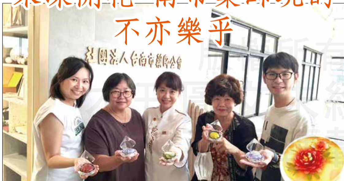
↑台南市藥師公會舉辦時下最流行的「果凍花」創作課程，栩栩如生的作品，讓所有參與的藥師都驚豔不已。