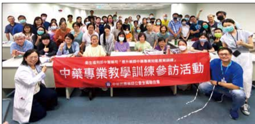
↑藥師公會全聯會於7月9日舉辦提升藥師中藥專業知能教育訓練。