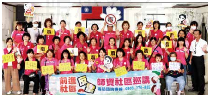
↑雲林縣衛生局毒品危害防治中心邀請縣內藥師宣講「正確用藥與毒品危害防制」。

課程中教導民眾該如何正確使用藥物，如藥品要怎麼吃、一天需要吃幾次、忘記服用藥物補服的正確時間點等。另外，毒品危害社會新聞資料彙整分享，透過道具與民眾的互動，來加強正確反毒的觀念，像是新興毒品物質的偽裝或是醫用氣體笑氣的非法濫用，加強民眾「拒毒、反毒、不要毒」立場。會中提供衛生局戒毒專線0800-770885向毒品說不，鼓勵藥癮者就醫，重返社會迎向美好人生。