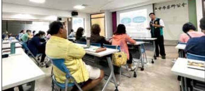
↑藥師公會全聯會於7月30日，辦理中藥執業四大場域的藥師實務經驗交流研討會。