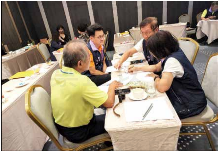
↑台南市藥師公會於8月6日舉辦第31屆理監事共識營，並分組討論未來三年的計畫。