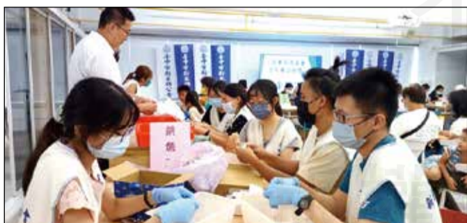
↑筆者看到管制藥品銷毀作業完成後藥師露出了如釋重負的笑容，讚嘆：原來現場不是80名藥師而是80尊藥師佛！