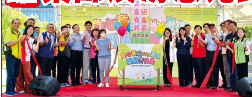
↑高雄市政府毒品防制局於8月12日在鼓山區凹子底公園舉辦「童心童玩闖關齊反毒」親子活動。