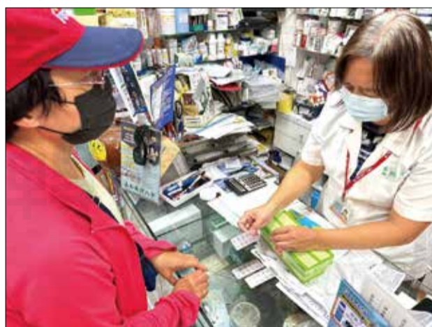
↑「用藥問題找藥師,看病請找醫師」。