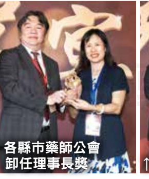
↑各縣市藥師公會卸任理事長獎