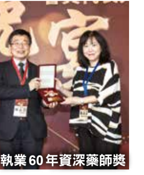
↑執業60年資深藥師獎