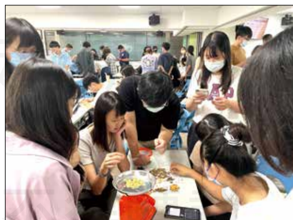
↑台中市藥師公會實習輔導委員會今年特別安排「中藥實作課程」，讓藥學生了解更多中藥在社區藥局執行範疇。

從親自動手做來體驗中藥，讓藥學生「看、摸、聞」中藥，了解中藥可以很生活化，明白中藥的面向其實很廣泛，並非傳統想像的那樣。期許能埋下藥學生對中藥的興趣，中藥和西藥一樣都是藥，將來有機會執業時能將中藥列入服務的範圍。