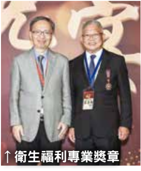
↑衛生福利專業獎章

總統蔡英文雖因公無法出席，也透過影片的方式勉勵所有藥師朋友。她表示政府成立「藥品供應通報處理中心」協助藥品調度，保障民眾的用藥權益，感謝各位藥師的協助與配合。