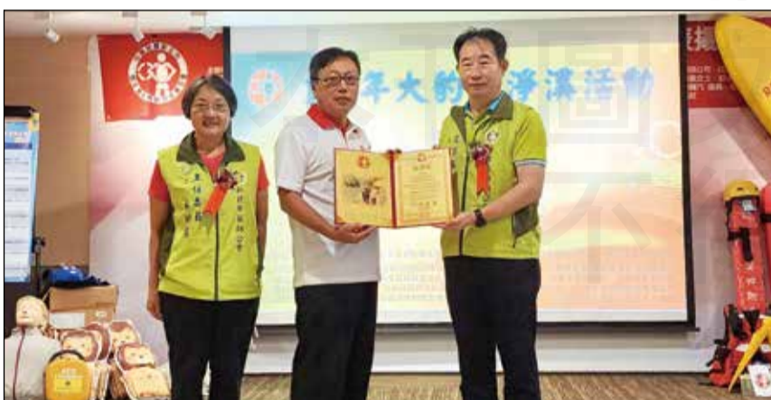
↑新北市藥師公會於「112年大豹溪淨溪活動捐贈暨救溺英雄表揚活動」接受表揚。