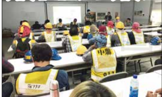
↑柳營奇美醫院舉辦泰籍移工藥物濫用防制宣導。