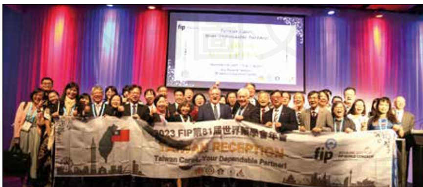
↑ FIP臺灣之夜交流氣氛歡樂熱絡。(攝影/藥師許育嘉、何臻耀)