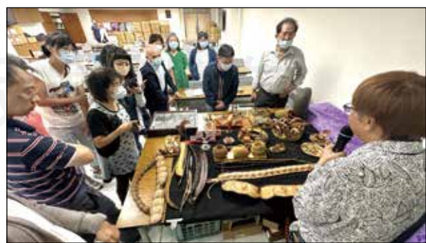
↑桃園市藥師公會於9月10日辦理中藥課程。

在本次課程中，講師重新幫藥師們複習物種的學名命名法則、各式詞綴(附加在詞根上的虛