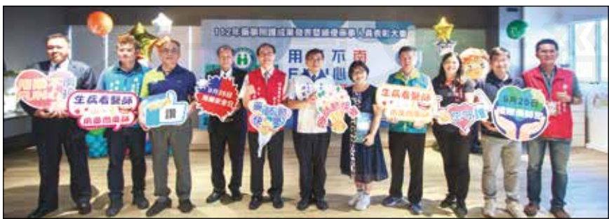
↑南投縣政府於9月24日舉辦「112年藥事照護成果發表暨績優藥事人員表彰大會」。