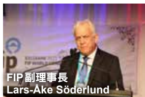
FIP副理事長 Lars-Åke Söderlund