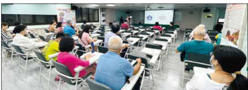
↑國健署「112年社區藥局辦理長者功能評估及血壓腰圍管理服務試辦計畫」於9月10日舉行實體增能研習營。