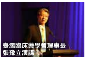
臺灣臨床藥學會理事長 張豫立演講