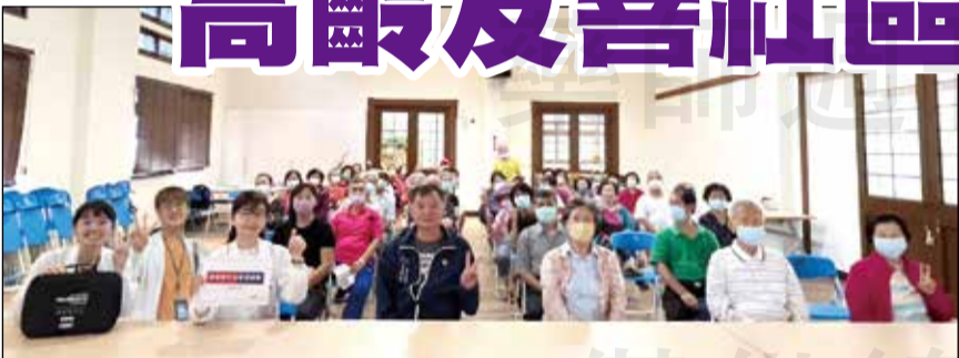
↑用藥安全講座圓滿落幕，藥師與里長及里民們一起大合照。