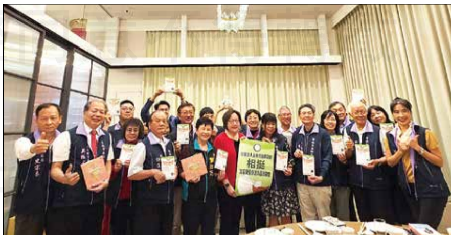
↑台南市藥師公會於12月10日舉辦理監事會議，對於藥師參選不分區立委給予支持，並成立後援會為他們全力助選。