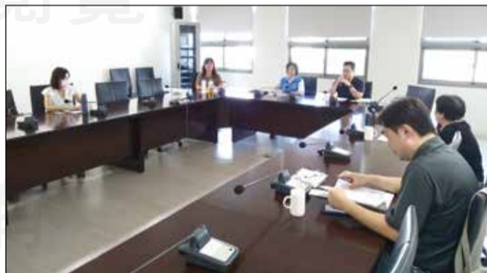
↑苗栗縣藥師公會「執行在地藥事服務計畫」，並於11月1日召開成果會議。