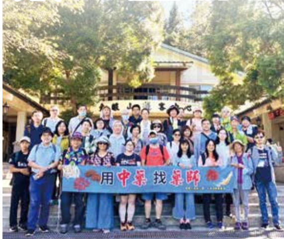
↑桃園市藥師公會「中藥發展委員會」，於11月5日舉辦東眼山採藥活動。