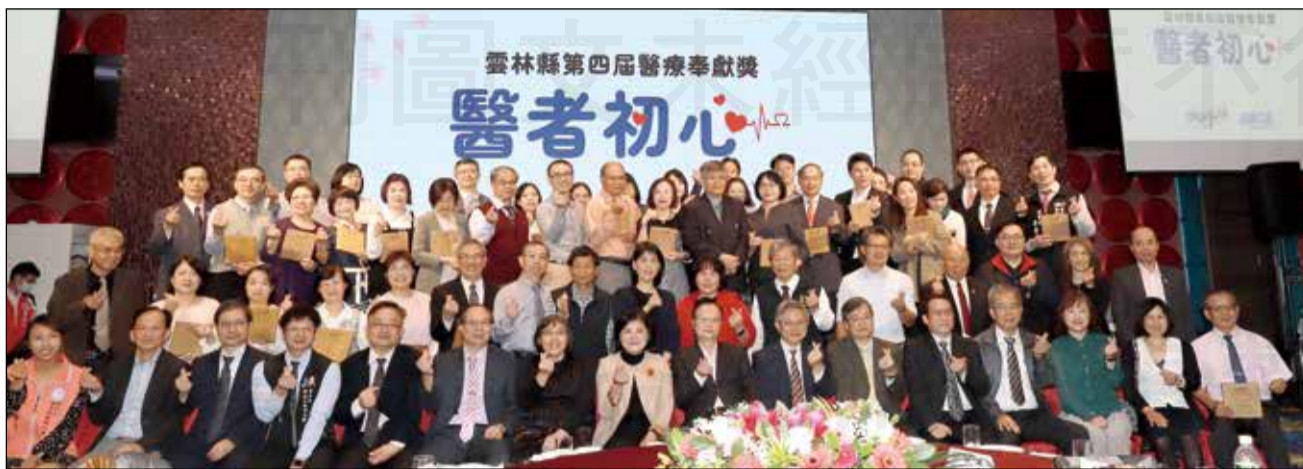
↑雲林縣衛生局於12月3日舉辦「112年醫療奉獻獎表揚典禮暨醫事團體座談會」。