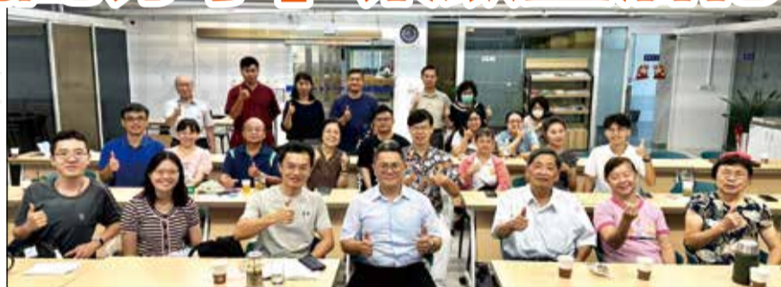
↑臺中市新藥師公會舉辦「中藥茶飲調配分享」，藥師分享如何將茶飲生活化。