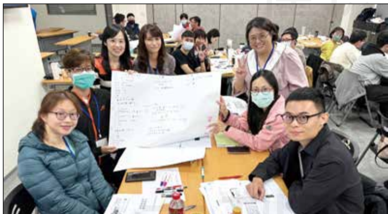
↑運動藥師計畫進階課程11月25日在藥師公會全聯會舉行。