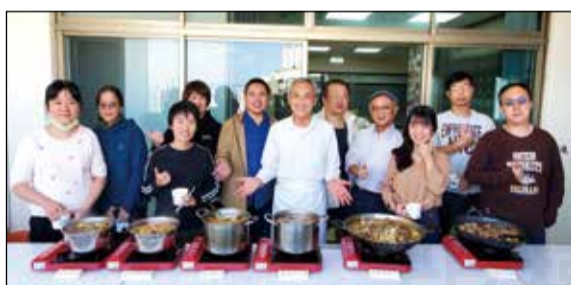
↑「秋、冬常用藥膳實作暨養生藥酒浸泡課程」，11月19日於台中市藥師公會大會議室開爐烹煮開課。