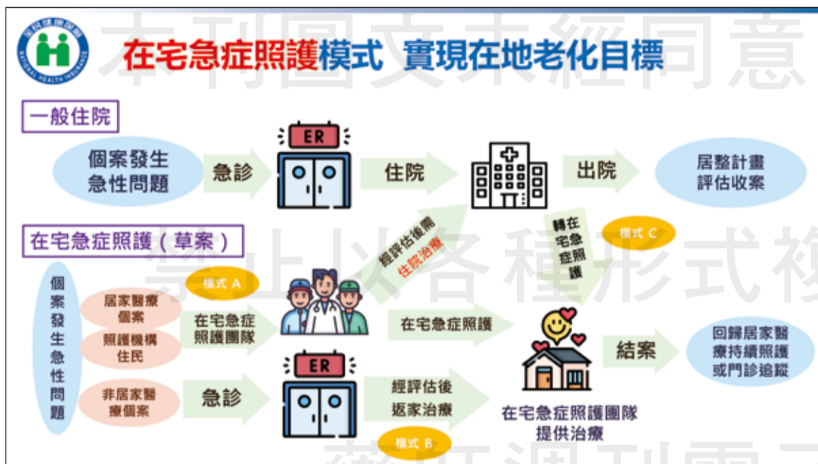
↑ 在在宅急症照護的三種模式