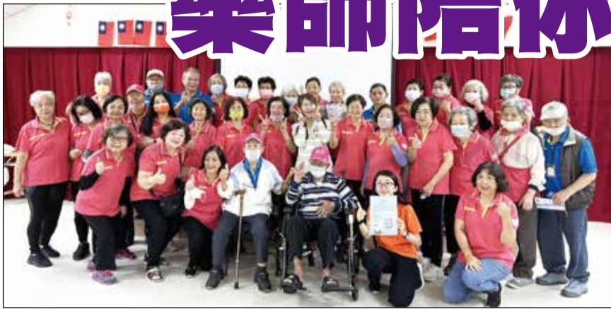
↑桃園市藥師公會為推廣食藥署整合友善用藥安全網路計畫，跟長者一起聊藥師。

◎文／桃園市記者藍偉玲 市藥師公會為推廣食藥署整合友善用藥安全網路計畫，偕同弘道