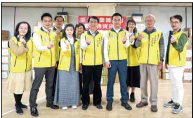
↑臺北市藥師公會舉辦「募集物資」公益活動。