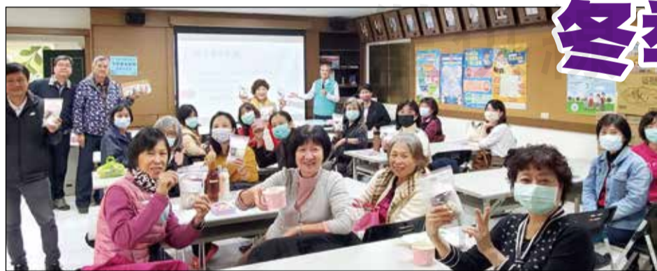
↑嘉義市藥師公會舉辦「冬季養生藥膳」課程。