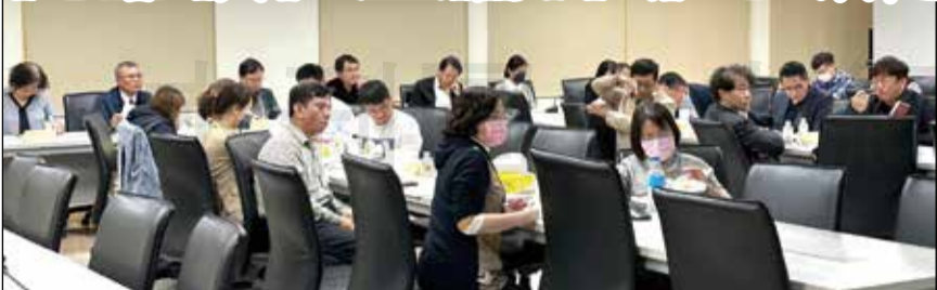
↑ 高雄市衛生局於1月10日召開113年農曆春節「基層診所開設呼吸道傳染病門診獎勵計畫」會議。