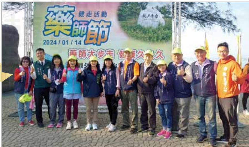
↑台南市藥師公會於1月14日慶祝藥師節，舉辦「藥師大步走 健康久久久」活動。

整個活動中，主辦單位安排各種禮物在台江公園的休息處，也有餅乾水果讓參加人員補充體力；為了進一步激發參與者的熱情，設置摸彩活動，讓幸運兒有機會獲得更多的驚喜。活動現場洋溢著歡笑聲和樂的氛圍，仿佛整個台江公園都被這場健走活動