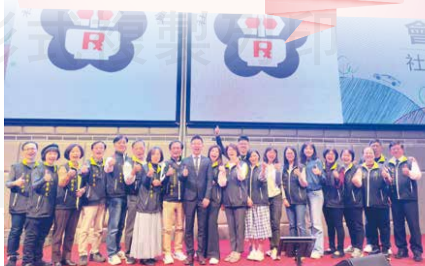
↑新竹縣藥師公會於1月7日舉辦年度藥師節暨會員大會。