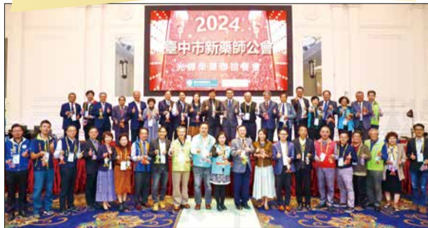
↑臺中市新藥師公會於1月14日舉辦「光輝榮藥聯誼餐會」。