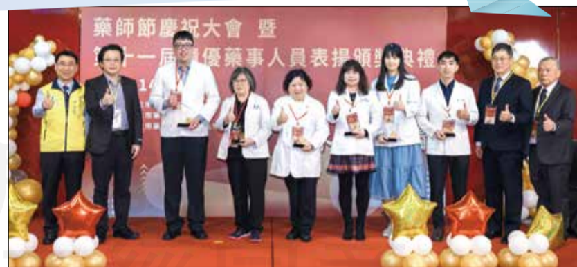
↑臺北市藥師公會舉辦113年藥師節慶祝活動暨第十一屆績優藥師頒獎典禮。