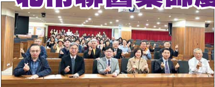
↑ 臺北市立聯合醫院藥劑部於1月15日舉辦20周年院慶暨藥師節慶祝大會。