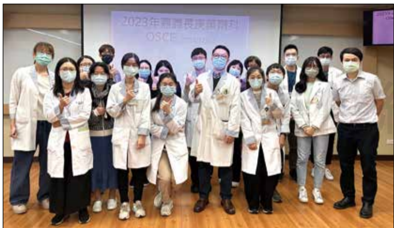
↑嘉義長庚醫院藥劑科在臨床技能中心舉辦 OSCE。