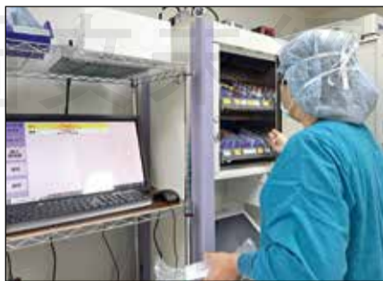
↑ Litera 藥櫃系統自行偵測取藥品項與數量。