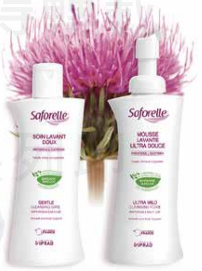
私密沐浴露 私密沐浴泡泡