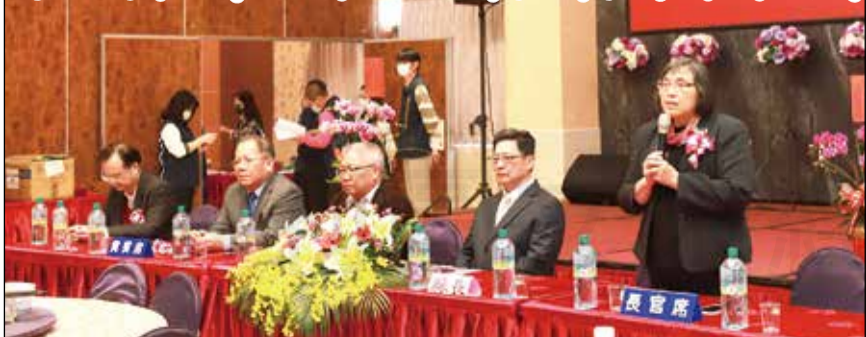
↑雲林縣藥師公會於1月21日舉辦會員代表大會暨歡慶藥師節。