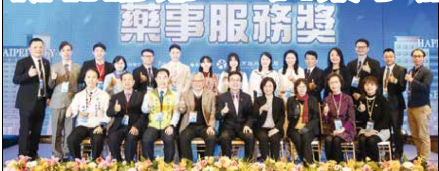
↑新北市政府於1月3日舉辦「第12屆藥事服務獎頒獎典禮」。