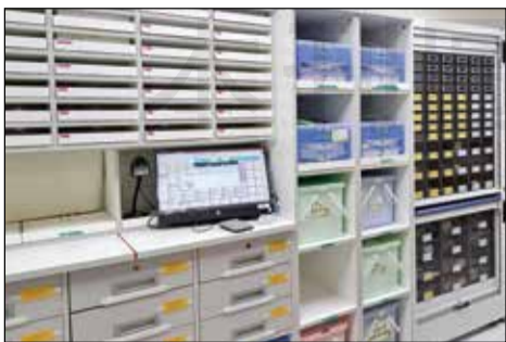
↑ 麻醉科藥品智能管理設備。