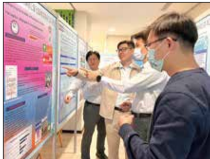
↑臺中市藥師公會於1月7日舉行第32屆第三次會員代表大會，並把投稿2023FAPA的poster特別展示在會館。