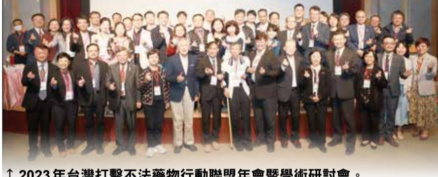
↑ 2023年台灣打擊不法藥物行動聯盟年會暨學術研討會。