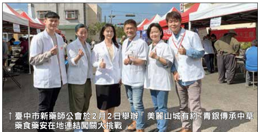
↑臺中市新藥師公會於2月2日舉辦「美麗山城有約-青銀傳承中草藥食藥安在地連結闖關大挑戰」。