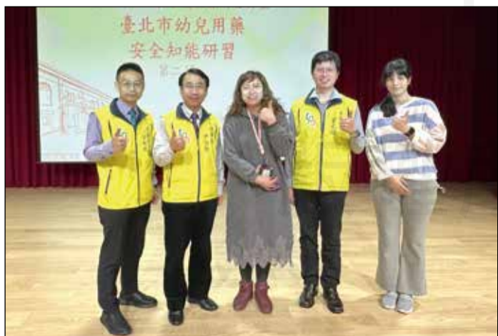
↑臺北市藥師公會與臺北市政府教育局共同合作，舉辦兩場幼兒用藥安全知能研習。