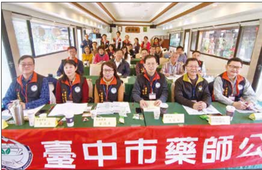
↑臺中市藥師公會於3月3日召開本年度計畫報告會議。