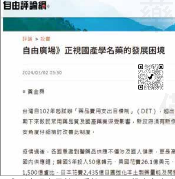
↑全聯會理事長黃金舜於3月2日投書自由時報自由廣場《正視國產學名藥的發展困境》。

【本刊訊】健保署公布今年藥品價格調整結果，新藥價於4月1日上路，此次藥品價格調整主要有三類，分別是心臟血管藥品、神經系統藥品及全身性抗感染劑。健保署表示，省下來藥費挹注於新藥、新科技，但藥界擔心，老藥恐退場，影響慢性病人用藥權益。