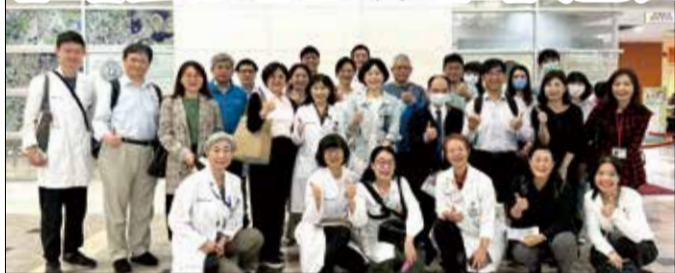
↑北部醫院暨奇美醫院參訪成大醫院藥劑部之智慧藥局。