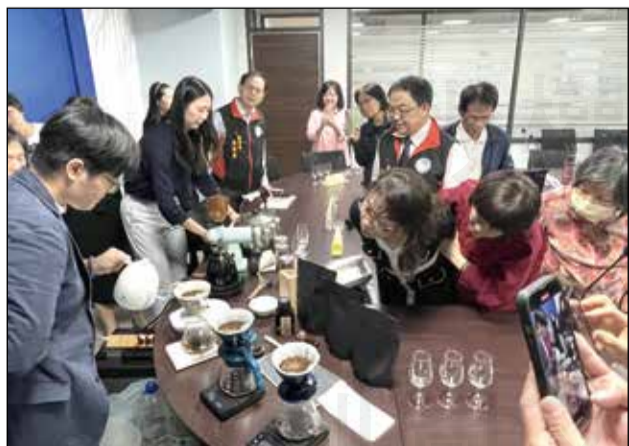
↑ 臺中市藥師公會於2月25日舉辦「精品咖啡風味感官專場講座」。