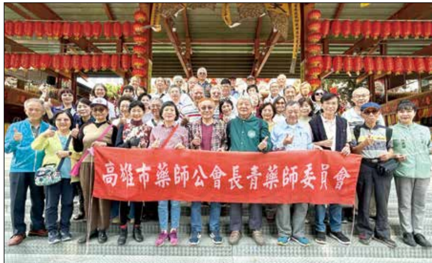
↑高雄市藥師公會於2月25日舉辦「113年長青元宵祈福點燈活動」。

元宵節（另稱上元節）為農曆新年後的第一個月圓之夜，象徵著春天的到來，佛教在農曆正月十五這天有點燈祭佛的習俗，而在道教中，元宵節是天官大帝的誕辰日，天官大帝亦稱「三界公」，是僅次於玉皇大帝的神明，因此屬於普天同慶的好節日。