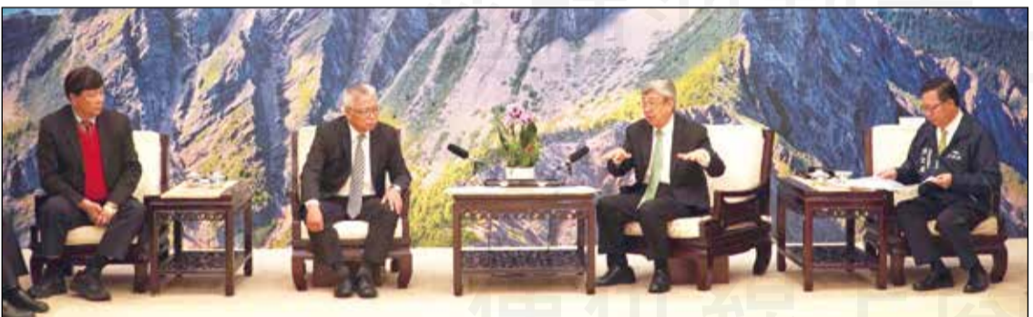
↑藥師公會全聯會理事長黃金舜於112年12月28日偕同幹部拜會行政院長陳建仁、副院長鄭文燦，爭取社區藥局調劑抗病毒藥物獎勵金事宜。