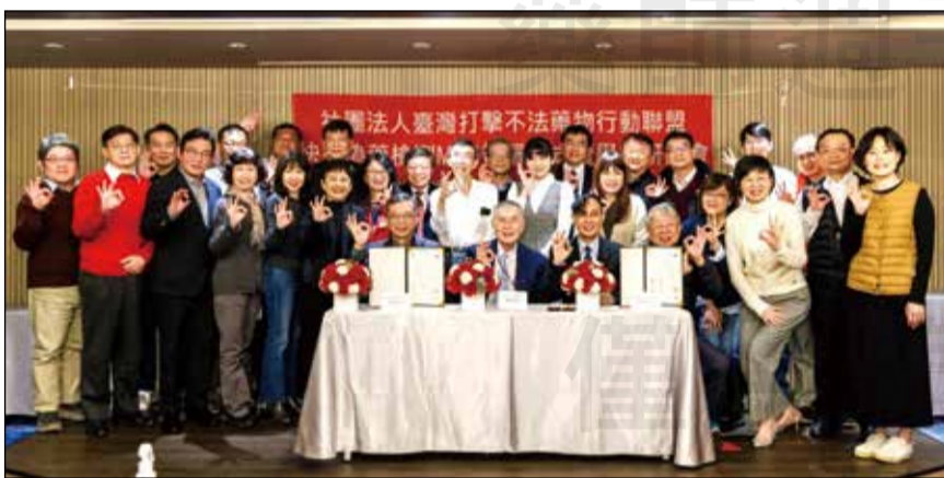
↑臺灣打擊不法藥物行動聯盟與大仁科技大學於3月2日完成快速偽藥檢測MOU簽署。