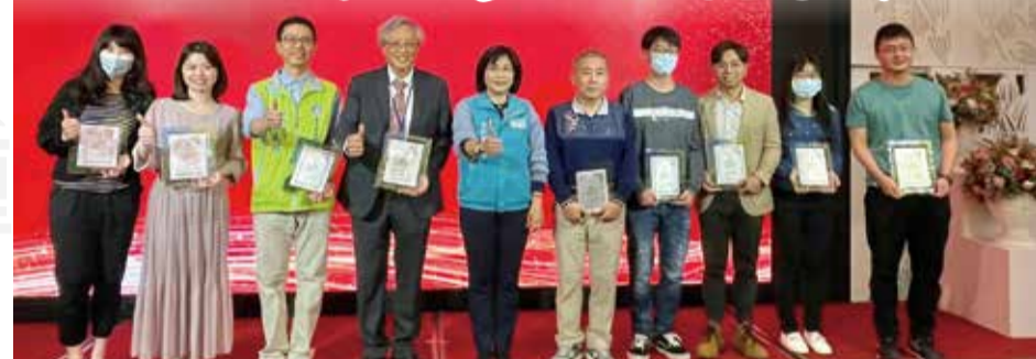
↑嘉義縣藥師公會於3月3日召開第28屆第三次會員代表大會暨聯誼餐會。