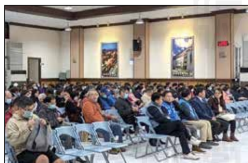
↑桃園市藥師公會於3月7日辦理社區藥局分區座談會。