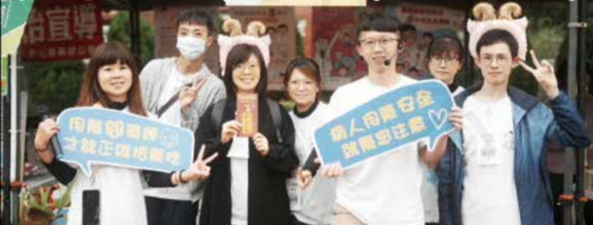
↑醫院藥師於世界腎臟病日舉辦愛腎保腎活動。