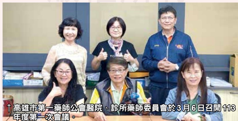
↑高雄市第一藥師公會醫院、診所藥師委員會於3月6日召開113年度第一次會議。