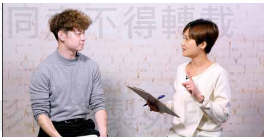
↑ 臺北市藥師公會協力推出的網路節目「藥師好好說」已於4月上線。