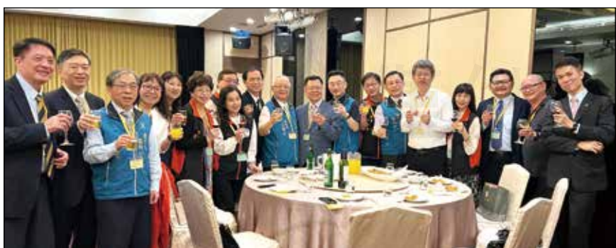
↑臺中市藥師公會與臺中市醫師公會於3月24日舉辦醫藥座談餐會。