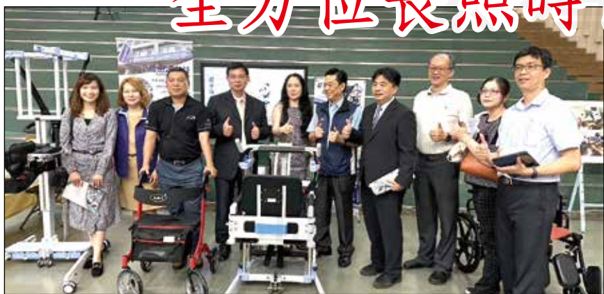
↑打造「全方位長照AI智慧人才培育訓練基地」於3月23日啟用開幕。