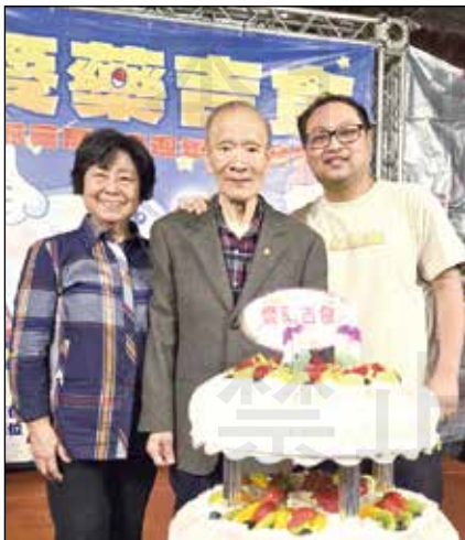
↑頭城藥局60周年舉辦「愛藥吉食」感恩活動。