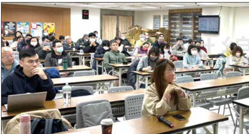
↑桃園市藥師公會於3月10日舉辦友善特色藥局增能課。