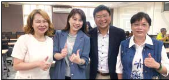
↑ 高雄市長期照顧發展協會舉辦會員大會，藥師等各領域專家與會。