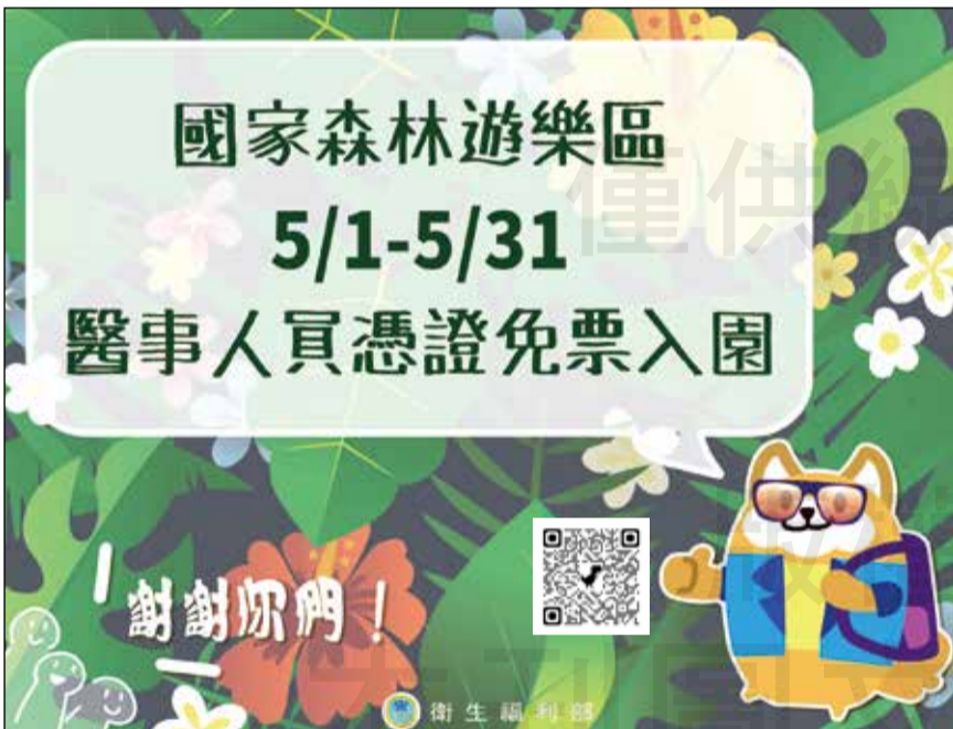
↑ 今年5月1~31日慰勞醫事人員，有14處國家森林遊樂區免費入場。