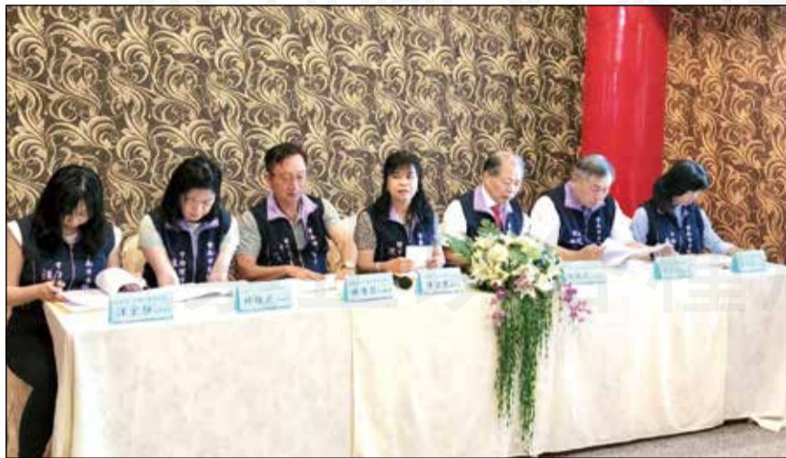
↑台南市藥師公會第31屆理監事於今年就職滿周年。