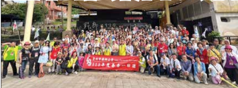
↑ 臺北市藥師公會春遊會員於野柳地質公園大合照。