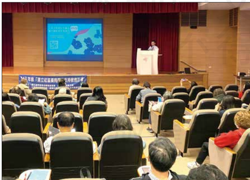
↑高雄市第一藥師公會舉辦疫後繼續教育課程，藥界的菁英齊聚一堂。