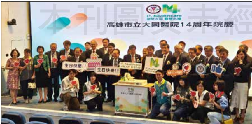
↑ 高雄市立大同醫院藉院慶活動進行為期兩天的偏鄉醫療服務。