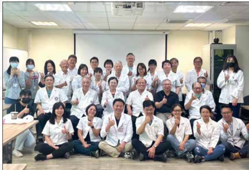
↑彰化縣衛生所糖尿病藥事照護計畫舉辦增能課程。