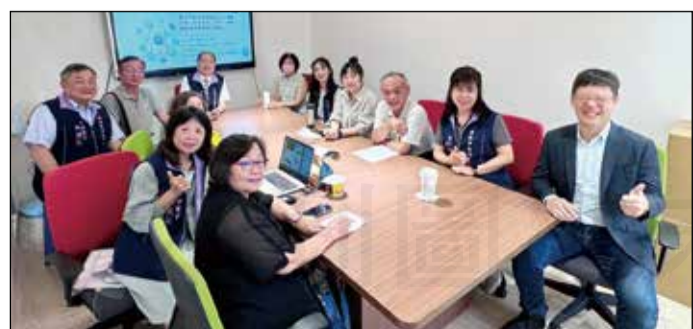
↑藥師公會全聯會與台南市藥師公會舉辦社區藥局照護計畫小組會議。