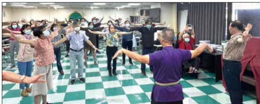
↑ 高雄市藥師公會舉辦四月份讀書會假日課程。