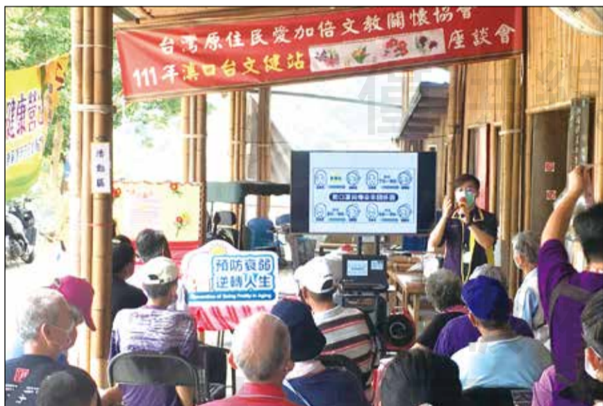
↑衛生所藥師於復興區溪口部落座談會宣導用藥安全。