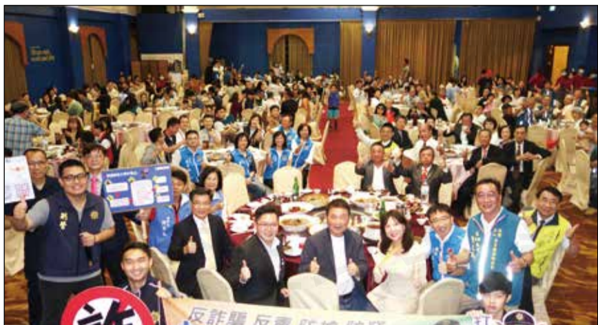
↑苗栗縣藥師公會於5月10日召開第22屆第3次會員代表大會，苗栗縣長鍾東錦親自出席與會。