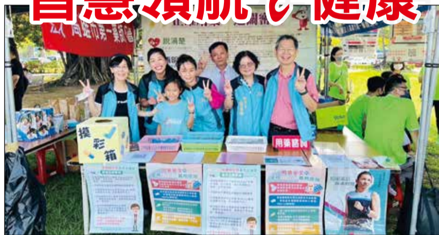
↑健保署於5月11日舉辦全民健保Plus嘉年華活動，高雄市第一藥師公會設置數位健康服務宣導闖關攤位。