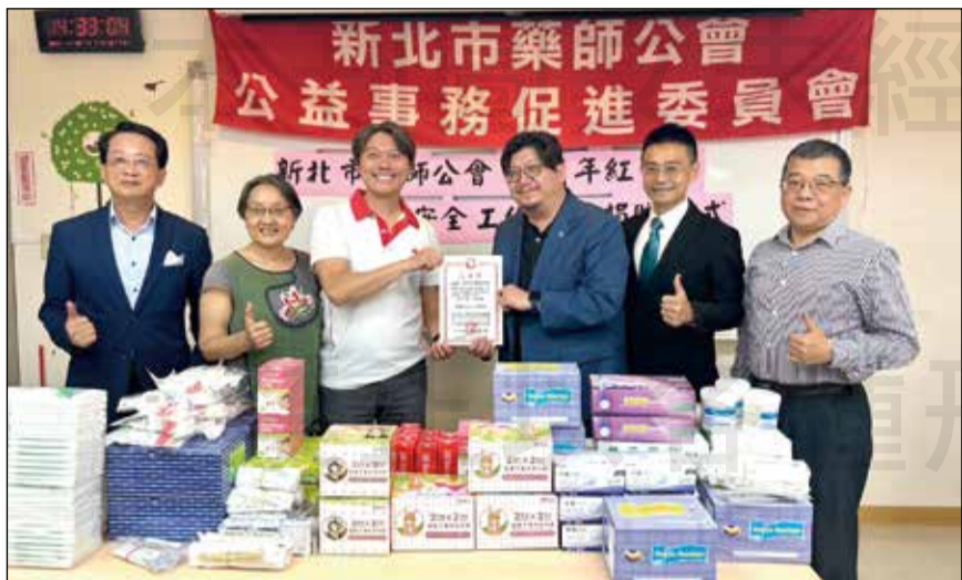
↑新北市藥師公會於4月30日與各單位共同捐贈醫材給紅十字會水岸工作大隊。