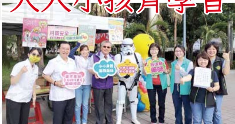
↑高雄市衛生局聯合高雄市藥師公會等醫藥團體於4月20日舉辦「寶健康·寶安全·囡仔雄幸福」宣導活動。