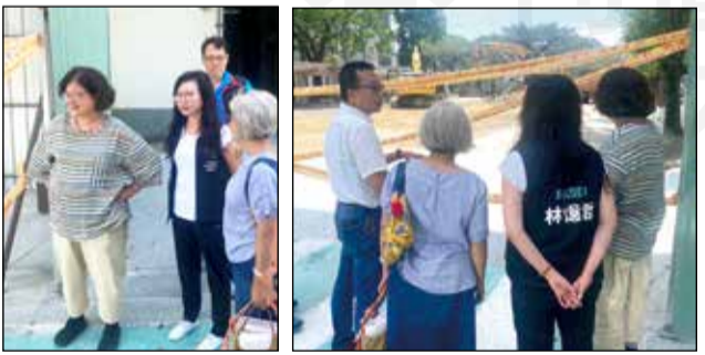
↑立委林憶君視察大地震災情，針對偽禁藥物流竄網路騙取災難財，於4月29日發文衛福部，要求嚴查。

【本刊訊】403大地震重創花蓮經濟以及民眾生活，日前更有不肖分子，利用網路等管道，詐騙民眾有關壯陽藥等藥品，藥師公會全聯會已在第一時間發布新聞稿譴責外，立委林憶君也於4月29日發文衛福部，要求嚴查網路藥品詐騙問題，衛福部也做出回應，表示將加強抽查邊境快遞郵包，並監控網路非法購藥、代購等問題。