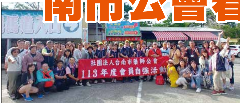
↑台南市藥師公會於4月28日舉辦會員春遊客家庄。