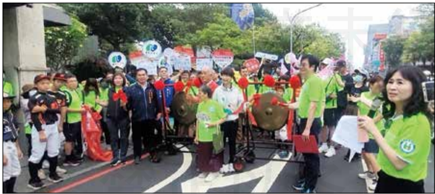
↑ 健保署於5月18日舉辦「府城古蹟趴趴go 健康快樂more & more」踩街活動。