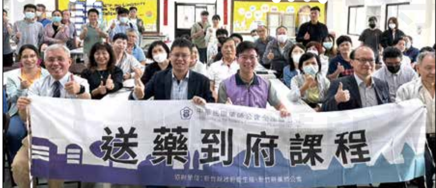
↑ 藥師公會全聯會於5月19日舉辦送藥到府課程新竹場。