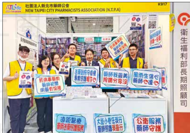
↑ 新北市藥師公會參與台灣輔具暨長期照顧大展。