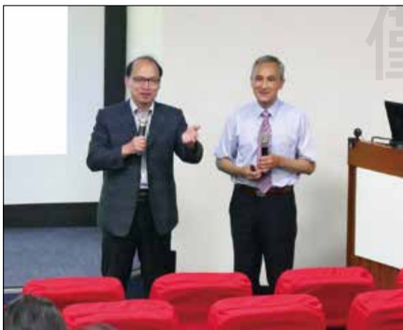
↑新竹市藥師公會舉辦113年20點繼續教育實體課程。