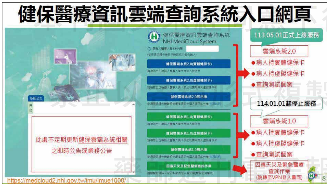
↑ 健保醫療資訊雲端查詢系統 2.0 登入畫面 (資料來源使用說明簡報檔)。