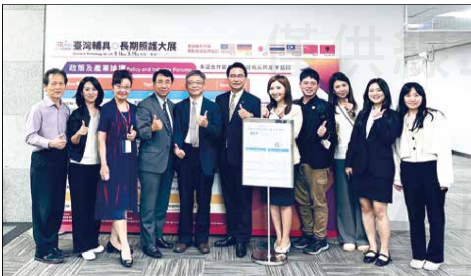
↑ 臺北市藥師公會與相關協會合辦樂齡經濟暨長期照顧論壇。