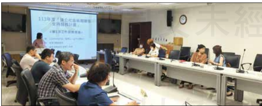
↑ 高雄市衛生局於4月24日召開「建立社區藥局藥事支持服務計畫」第一次工作籌備會議。