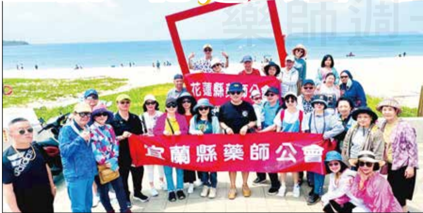
↑宜蘭、花蓮縣藥師公會同遊澎湖花火節。