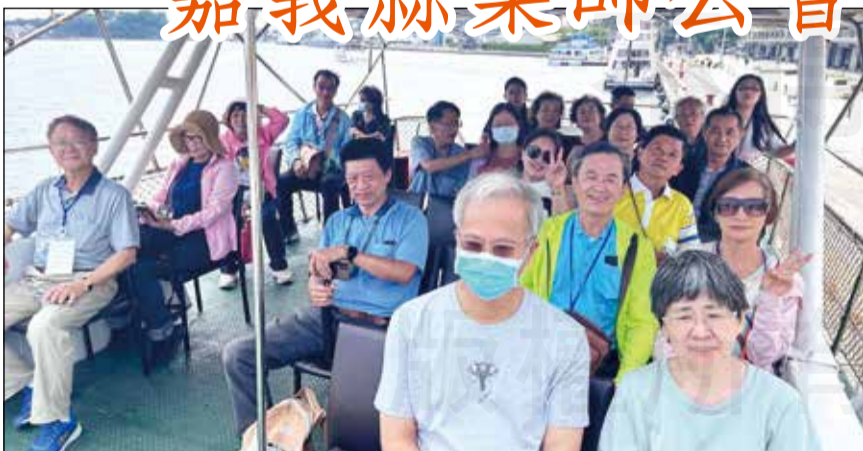
↑嘉義縣藥師公會於5月19日舉辦自強活動舒壓一日遊。