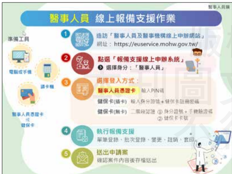
↑個別醫事人員操作新報備支援系統流程圖。