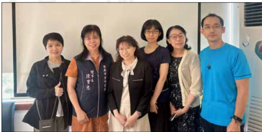
↑台南市藥師公會召開醫院藥師委員會會議，討論年度工作計畫。