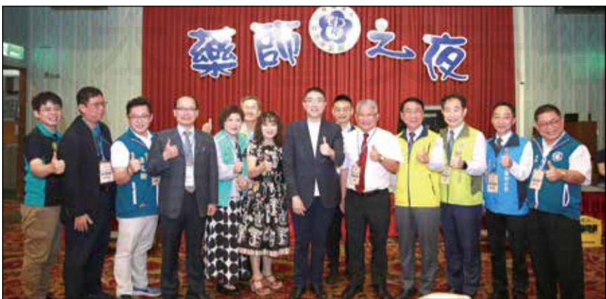
↑基隆市藥師公會舉辦第7屆第3次會員大會。