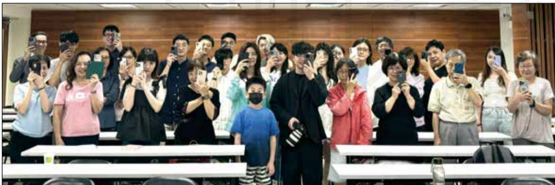
↑臺北市藥師公會年輕藥師委員會主辦A Frame for Life手機攝影講座。