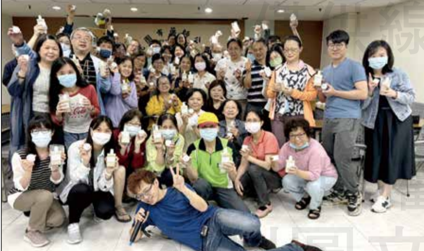
↑為推廣中草藥在生活的臨床應用，桃園市藥師公會舉行中草藥外用製劑臨床應用和實作課程。

◎文／桃園市記者藍偉玲 等外用皮膚藥物的民眾，除了西藥藥膏之外，藥師們是否會想到來尋找外傷、過敏、蚊蟲叮咬等使用