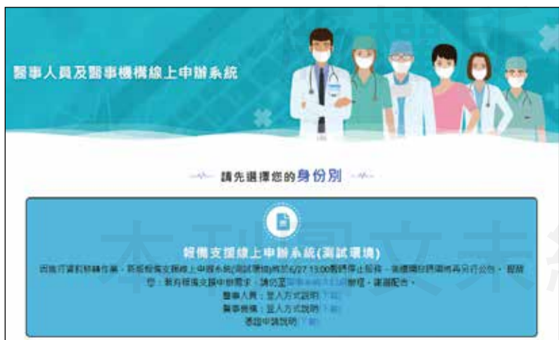
↑「醫事人員及醫事機構線上申辦系統」主頁面畫面。