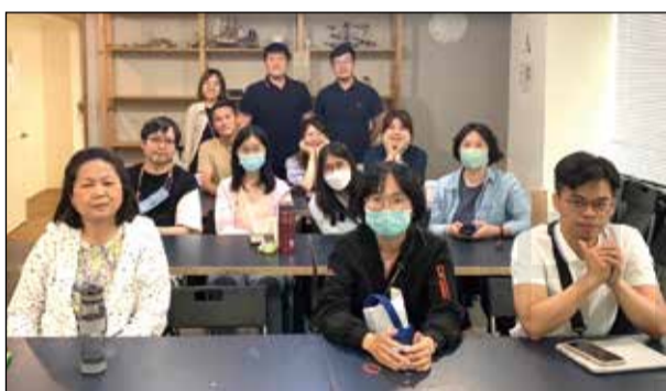
↑台灣年輕藥師協會於6月16日舉辦藥事人員愛滋教育課程。