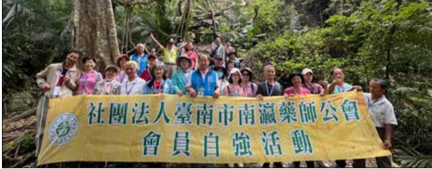
↑台南市南瀛藥師公會舉辦「台東二日遊」自強活動。