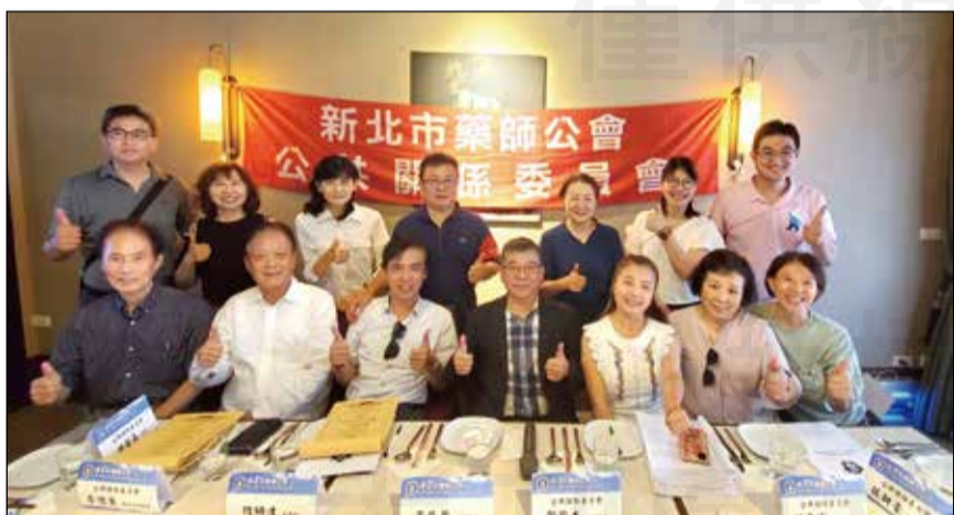
↑新北市藥師公會於6月23日舉辦公共關係委員會成立大會。