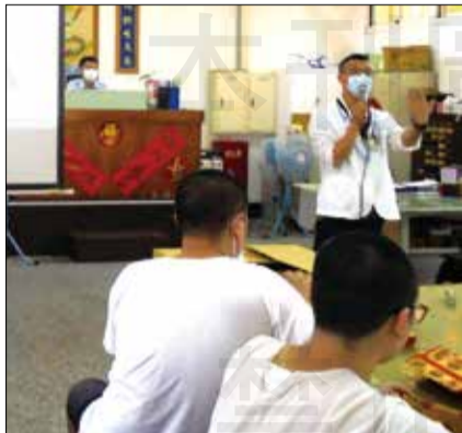
↑柳營奇美醫院藥劑部長期與台南第二監獄合作，進行藥物濫用防治宣導。