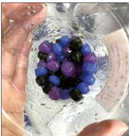
↑黑芝麻粉、蝶豆花藍、蝶豆花，加上檸檬變成美麗紫色珍珠，還有加了太多艾草粉的綠珍珠，煮熟變深綠色。