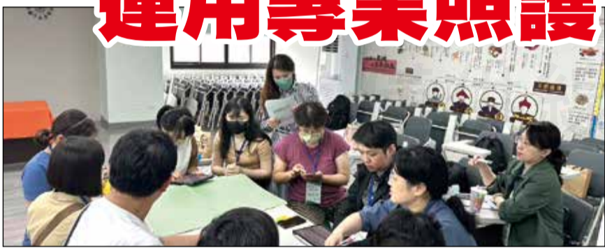
↑全聯會舉辦居家藥事照護藥師培訓課程南部場。