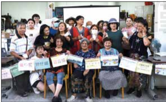
↑結合中醫藥健康教育與用藥安全的宣導活動。