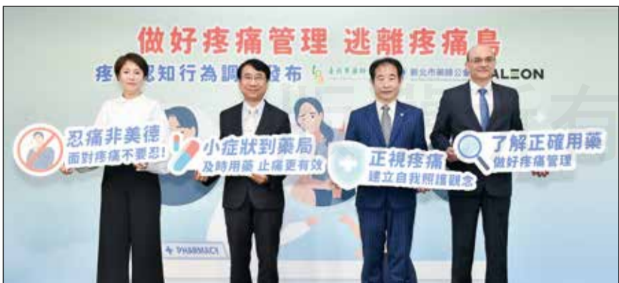
↑臺北市藥師公會、新北市藥師公會合辦「做好疼痛管理 遠離疼痛島」記者會。