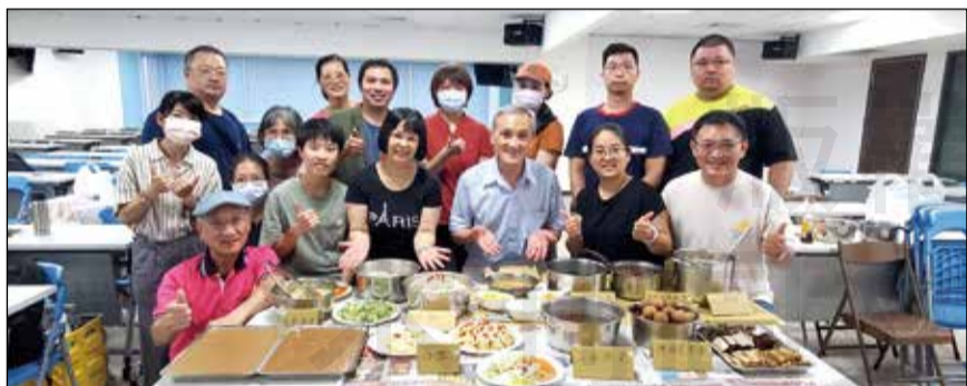
↑ 「夏季藥膳實作—冷盤、涼茶」，於台中市藥師公會大會議室實務操作上課。