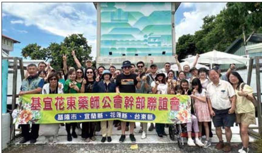
↑基宜花東四縣市於9月7、8日舉辦幹部聯誼。