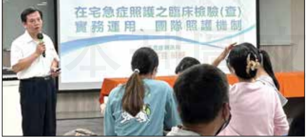
↑全聯會舉辦113年藥事人員在宅急症照護培訓課程(南部場)。