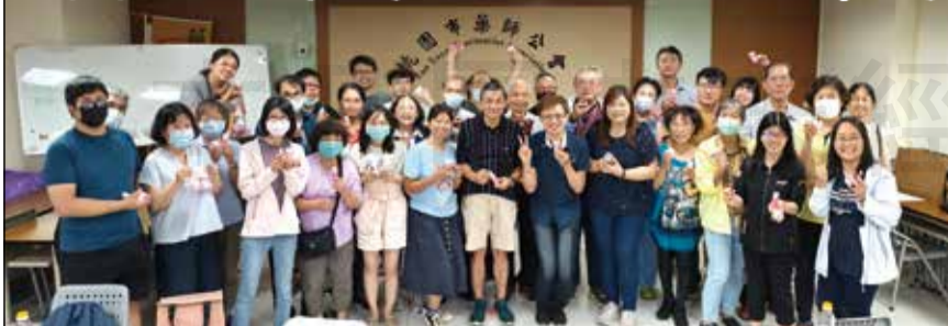
↑桃園市藥師公會中藥委員會於9月6日舉辦中藥手作課程。