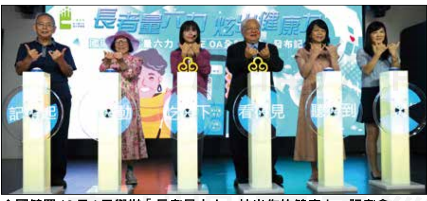
↑國健署10月1日舉辦「長者量六力，炫出你的健康力」記者會。右三為國健署長吳昭軍。

【本刊訊】國民健康署推出的「長者量六力」LINE官方帳號，目前已有20.8萬好友加入，可評估認知、行動、營養、視力、聽力及憂鬱等六大身體功能指標。今年增加互動功能，讓使用更加便