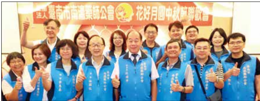
↑台南市南瀛藥師公會為活絡會員情誼，於9月8日舉辦中秋聯歡會。