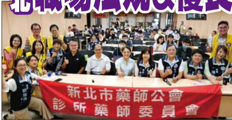
↑ 新北市藥師委員會舉辦職場法規與優良調劑課程。