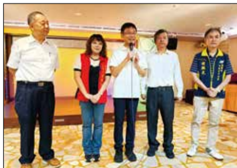
↑基隆市衛生局長與藥師公會共同研討基隆市公共衛生政策推動策略。