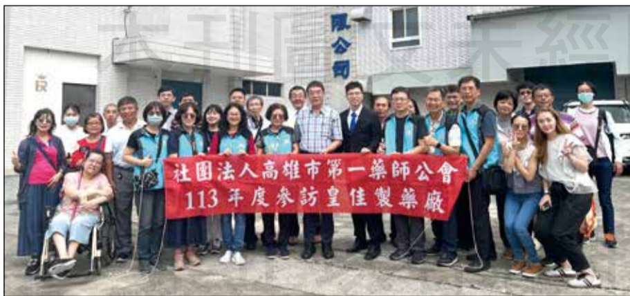
↑ 高雄市第一藥師公會舉辦藥廠參訪。