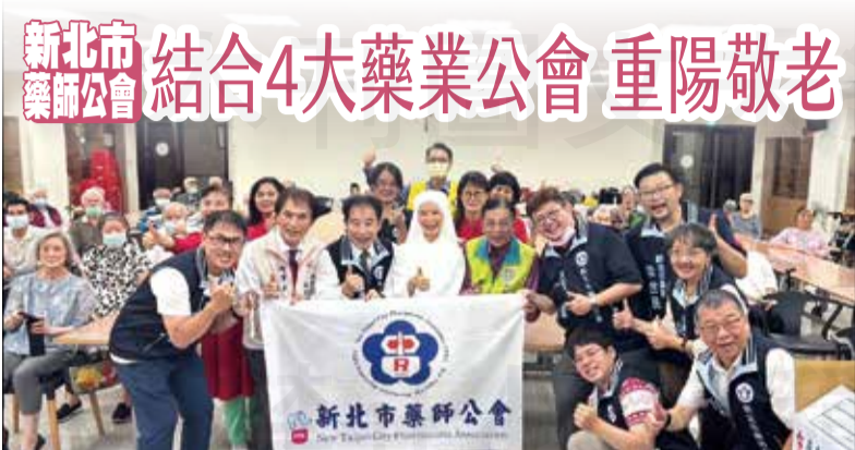
↑ 新北市藥師公會結合新北市四大藥業公會舉辦「天主教八里安養院敬老活動」。