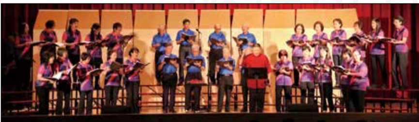
↑ 台灣藥師合唱團於10月5日舉辦20週年音樂會。