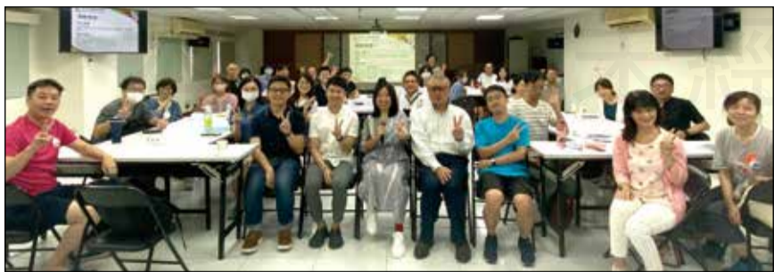
↑臺北市藥師公會舉辦「2024年英語友善藥局課程」，培訓藥局藥師之英語技能。