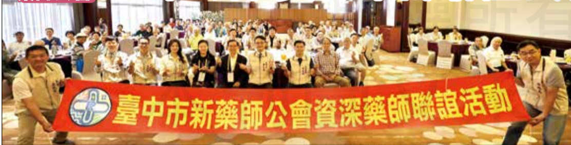
↑ 臺中市新藥師公會於國慶日舉辦資深藥師聯誼餐會。