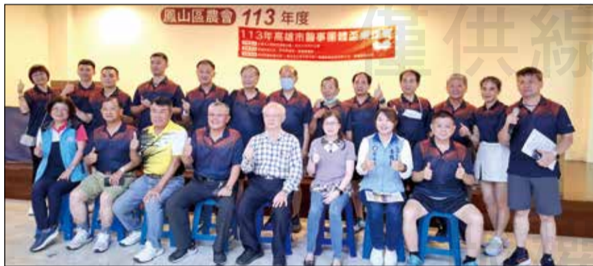
↑ 113年高雄市醫事團體盃桌球賽。