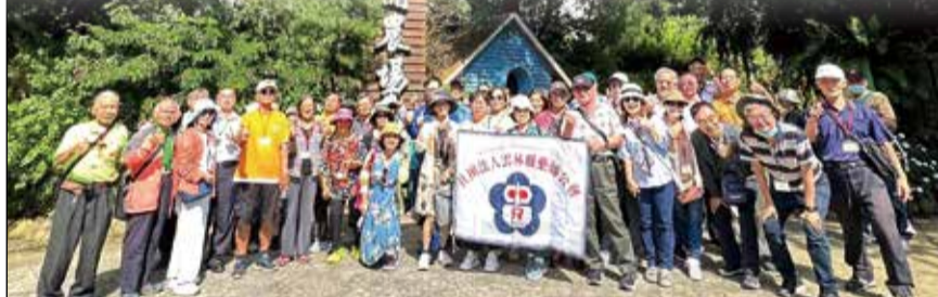
↑雲林縣藥師公會舉辦年度中部竹苗自強活動二日遊。