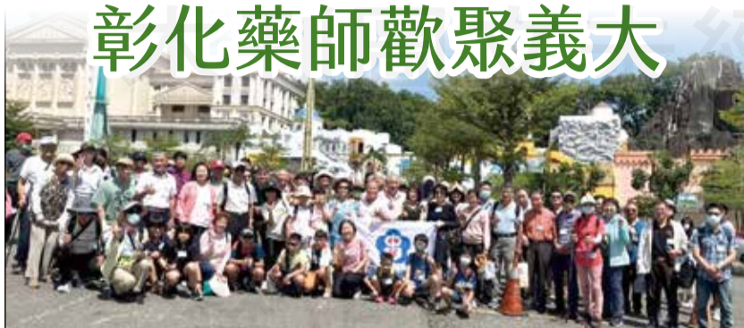
↑彰化縣藥師公會舉辦年度自強活動。