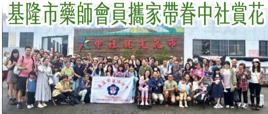
↑基隆市藥師公會舉辦會員一日遊。