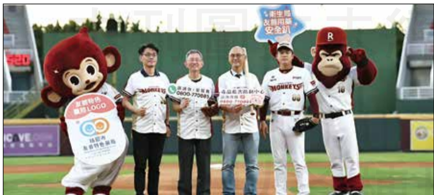
↑桃園市政府衛生局6月20日與桃園市藥師公會攜手，於樂天桃園棒球場舉辦「衛生局友善用藥安全趴」活動。