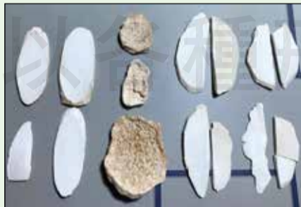
←由左至右分別為1、光山藥(悶製過搓圓打光，可見未去盡淺棕外皮)，2、筆者家中自購安心藥材山藥(已陳久變色，無過度加工不薰硫，不規則乾燥片狀)，3、混淆品木薯(刀削切皮邊，偶見中央木心，圖為裁切去木心後呈現單側筆直切邊)

與浸膏比例原則為1：1，最高不得超過1：3，變動範圍須控制在±15%。此外含酒精製劑若超0.5%，須依菸酒管理法辦理並申請執照方可販售，不可忽視法規細節。