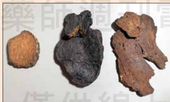
←由左至右為黃藥子(周圍皮部有白色根鬚痕跡，黃色片)，製首烏(黑色表面，能因頭尾片差異而無雲錦花紋呈現，折斷面紅褐色)，紅藥子(皮部深棕色，中央處明顯木質心)