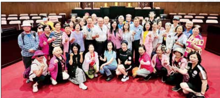
↑花蓮縣藥師公會於7月3日參訪立法院。