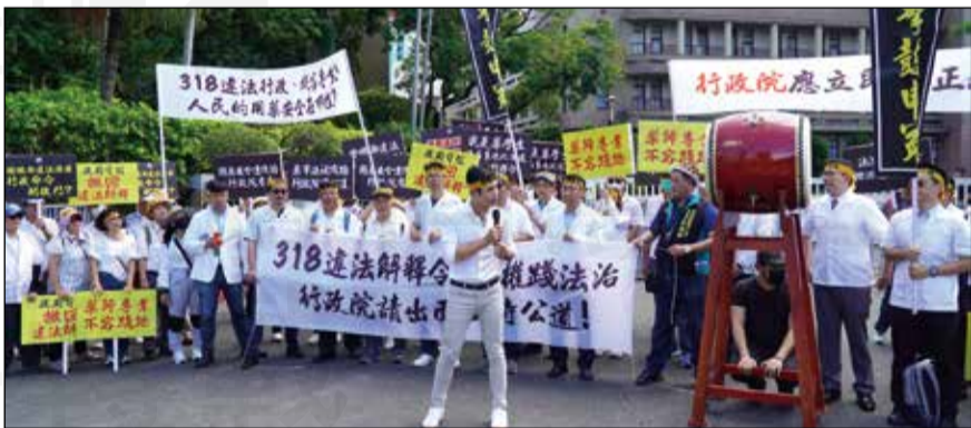
↑花蓮縣藥師公會參與7月4日行政院前的陳抗行動。

7月4日，前往行政院與全聯會人員集合，在10點配合理事長黃金舜率領的台北市、花蓮縣及澎湖縣三位公會理事長及公會幹部，在行政院前擊鼓申冤，控訴衛福部318違法解釋令，同時提交陳情書給行政院官員，強烈表達全國藥師對行政院的訴求，希望衛福部撤回318的不公不義違法解釋令。現場近百名藥師及親友團在炎熱高溫酷暑下完成全聯會第八次的抗爭。