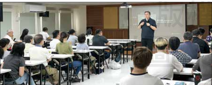
↑臺北市藥師公會於6月14日舉辦一場引人深思的MBTI性格公益講座。