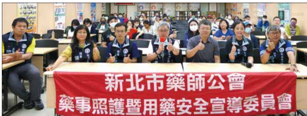
↑新北市藥師公會配合食藥署「促進多樣化藥事服務計畫」，舉辦繼續教育課程。