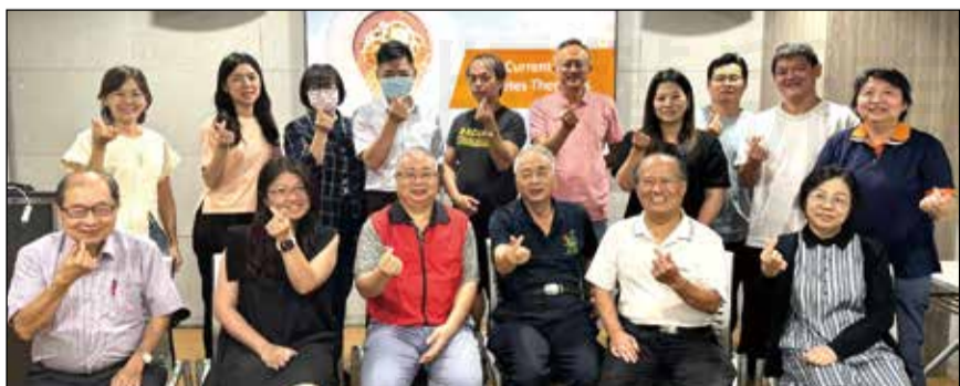
↑彰化縣114年衛生所糖尿病照護計畫期中暨輔導會議。